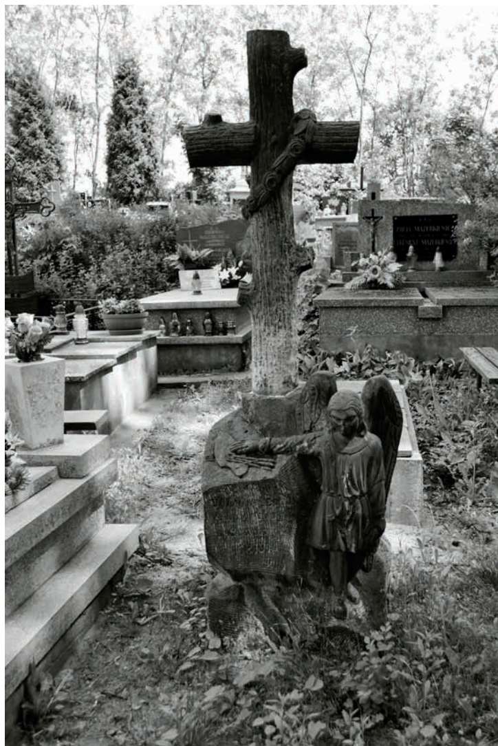
Grób Joanny Ledoux (zmarłej w 1897 roku) na cmentarzu parafialnym w Suchedniowie. Stan z 2010 roku.