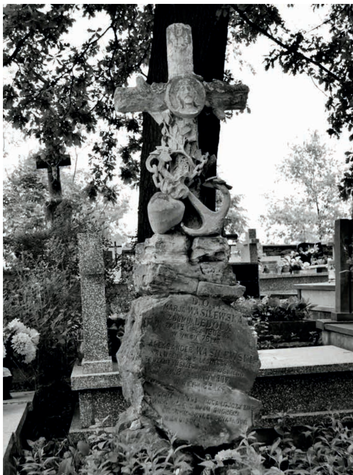
Grób rodziców Zygmunta Wasilewskiego na cmentarzu parafialnym w Suchedniowie. Stan z 2010 roku.